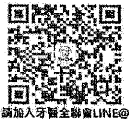
請加入牙醫全聯會LINE@