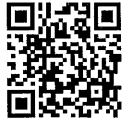
掃描 QR code 線上報名